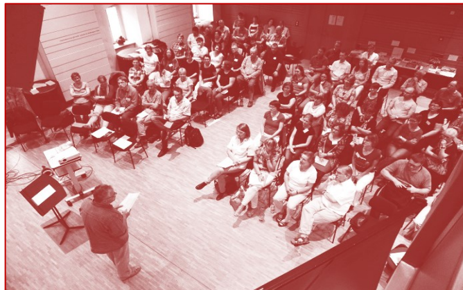
Foto.: Kirchenmusiktagung 2017 auf Schloss Colditz

Die anstellenden Kirchgemeinden werden gebeten, die Kantorinnen und Kantoren vom Dienst freizustellen und sich angemessen an den Unkosten zu beteiligen.