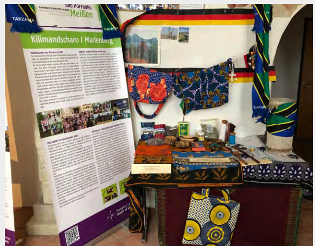
Ausstellung der Partnerschafts- gruppen im Kreuzgang der St. Afra Kirche