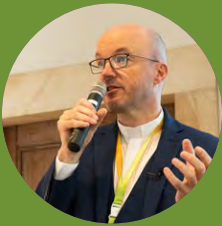
Landesbischof Tobias Bilz bei der Bibelarbeit