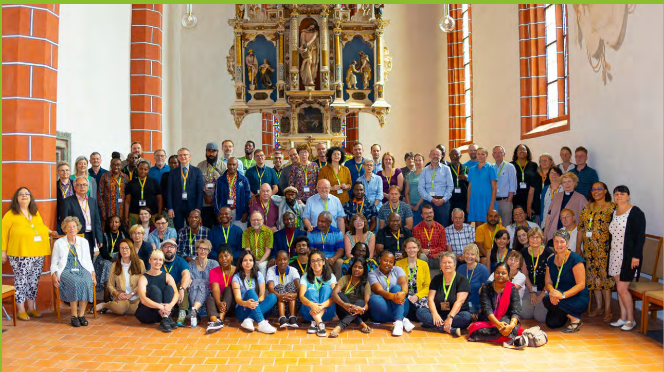
Die Teilnehmenden der Partnerschaftstagung in der St. Afra Kirche in Meißen