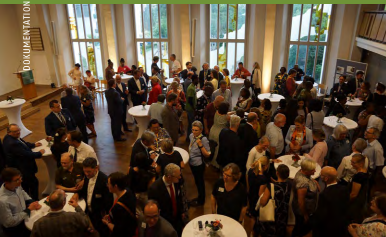
Empfang der Landeskirche in der Weinbergskirche Dresden-Trachenberge