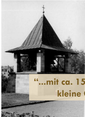
Glockenträger erbaut 1946 Kirchgebäude erbaut 1954-58